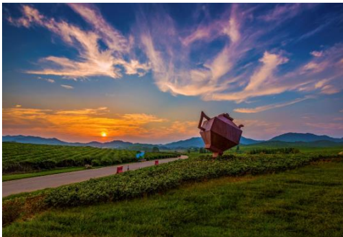
图7 德兴市香屯至名口公路构筑物展示区域文化

美丽乡村建设承载着传承乡村文化的重任，“美丽农村路”作为美丽乡村建设的重要部分，美丽农村路建设必须以文化为载体，坚持弘扬和继承乡村文化，是构建乡村社会生态和重建乡村文明和公路文明的关键，更是留住乡愁、记住乡愁的根本元素。