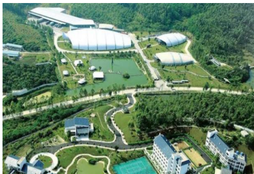
图 11 景甜百岁山水水厂依傍 X223 线而建

乡村振兴要有产业,产业发展交通先行。“美丽农村路”建设要着眼于乡村振兴、农业农村现代化,因地制宜发展乡土产业,充分利用农村公路串联、辐射作用,带动区域经济发展。