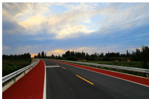
图6 敦煌景观大道标志标线清晰、安全生命防护设施齐全