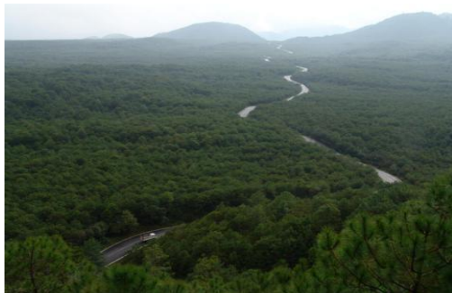
图3 腾冲市火山路注重沿线生态环境保护

“绿水青山就是金山银山”,路域环境是农村公路最直接的生态屏障,农村公路发展要贯彻生态文明理念,和美学思想有机结合,建设“生态性、景观性、协调性、持续性”的高质量“四好农村路”。