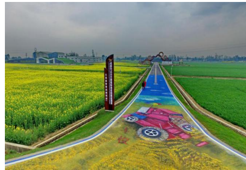
图8 成都三岔镇园区道路景观

其实践路径主要包括：一是充分发掘、展示乡土文化。注重农村公路内涵式发展，根据既有的资源禀赋、所处地域特征、村民意愿以及乡村文化等因素综合考量，通过用地、风貌、街巷、节点、建筑和景观等物质空间载体体现文化特质，“一路一特色、一线一品牌”，展示特色乡韵文化。二是完善公路公共文化设施。开展形式多样的以公路文化为主题的活动，深入实施文明素质、文化精品、文化产业、文化阵地、文化人才、文化旅游、科教发展、健康保障等工程，以提高公民爱路护路意识。此外，在人员相对集中区域，设置文化宣传栏，提高居民认同感。三是发挥农民的主体作用。从意识、机制、制度等维度调动农民的积极性，把农村公路之美内化于农民的具体行为之中，融进农民的生产生活中去，让农民深度参与雕琢“美丽农村路”。