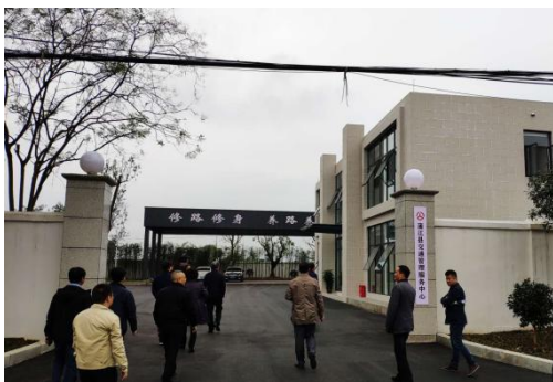
图9 浦江县交通管理服务中心综合执法

“四好农村路”“建好”是基础，“管好、护好、运营好”是目的。“美丽农村路”作为“四好农村路”高质量发展的重要抓手，在“建好”的前提下，强化组织保障、政策保障、资金保障、技术保障四个体系，创新运营模式，建立长效机制，实现农村公路可持续发展。