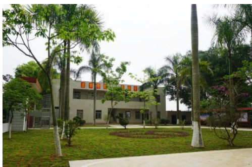
图5 博罗县利用横河道班设置农村公路驿站

在农村公路附属方面,“美丽农村路”典型特征主要体现在沿线服务设施、管理设施、交通安全设施等方面。在有限的资金下,充分发挥市场机制作用,科学的选取必要的附属设施及其功能,并与交通基础设施建设、产业发展、乡村振兴规划充分结合。