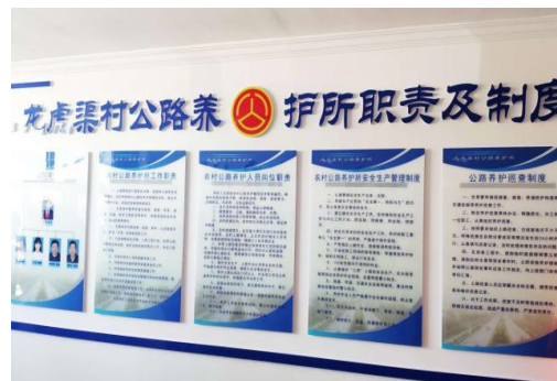
图10 鄂尔多斯龙虎渠村村级养护机构管护等功能

其实践路径包括：一是加强农村公路管理工作，实施农村公路“路长制”，建立覆盖县、乡、村道的组织管理体系；完善绩效考核制度，将“美丽农村路”工作纳入考核体系；探索开展信息化管理模式，提高农村公路管理效率。二是