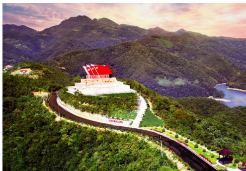
图 12 南漳县花朝路与红色旅游结合

其实践路径主要包括以下几个方面:一是“农村公路+旅游”融合发展,根据乡土自然、历史、人文特色发展休闲农业、特色小镇、乡村民宿等乡村旅游,鼓励建设农村公路慢行系统,完善驿站、露营地、停车区、观景台等服务设施,充分展示乡土原生态之美。二是分析区域产业发展需求和优势,建设资源路、产业路,把环境、资源、文化优势转化为产业优势,在农村公路发挥串联作用的同时,利用路侧景观、小品对特色产业进行表现和宣传。