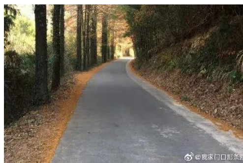
图4 安徽小岭路原生植被保护

实践路径主要包括:在规划设计阶段,以建设生态宜居的美丽乡村为导向,充分利用既有道路进行改造提升,注重对整体风貌、区域生态的保护,涉及的材料、资源尽量满足本土化、可再生、可循环利用;在建设过程中应减少大拆大建,以整代建减少对沿线环境的负面影响,提高精细化程度;在养护运营阶段注重对路域环境的治理,保证路域环境整洁、有序,保持公路美丽风貌;在运营阶段主要是推广节能、低碳运输装备,实现农村公路与自然生态和谐共生。