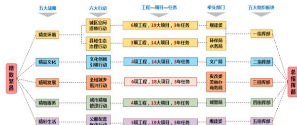
图2 “精筑繁昌”行动规划系统化实施框架

规划构建了五大愿景、六大行动、28个工程、97个项目，为近中远三期目标构架了细化到行动的控制指标体系（图3）；同时近期年度任务分解更细化的提出了项目子项名称、具体任务要求、资金估算及来源等内容，同时设置牵头部门及其他责任单位以供考评，文中以2018年度任务内容分解表和部门及预算为例展示（图4）；在规划实施维护上确立从“愿景目标—发展战略—指标体系—行动计划—体检反馈”层层深化分解的工作模式，提出了“一年一体检，五年一评估”目标，管控规划的六大行动内容不变形不走样。