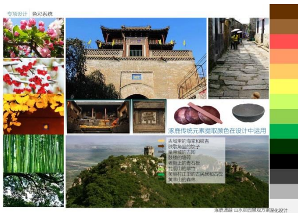
图6 色彩、材料与铺装

通道：本区域是业主归家的必由之处，在材料上以砖材与石板为主，局部点缀花岗岩，彰显出入口的亲切归家的感觉。停车位：呼应整个园区自然原则，植草格子增加绿化面积且美观实用。