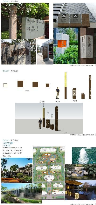
图8 标识系统、照明与水景