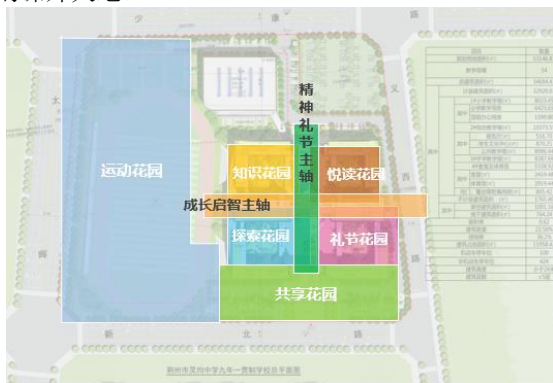
图6 灵均中学总体空间布置图

六园:知识花园、悦读花园、探索花园、礼节花园、运动花园、共享花园,面与面交叉,主要为教学楼的内部庭院,以教学区围合的公共空间,营造具有楚文化气息的桃园、橘园等植物专类园。结合学校中小学教育意义,同时兼具休闲与休憩功能,既有教育意义,又能营造古风自然的课外天地。