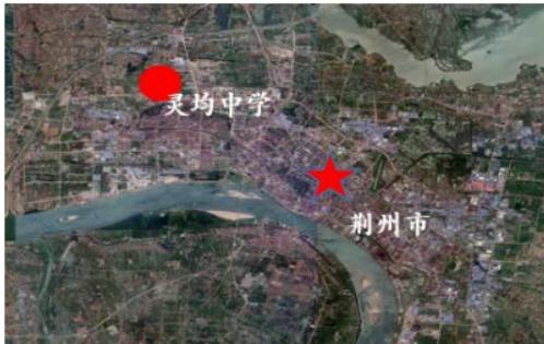
图1 灵均中学区位图

学校场地周边规划的道路满足学校功能，占地约为 79.72 亩，涵盖了当前校园环境主要的教学场所用地建筑。新校区工程用地形状成梯形，地块范围内现状主要以水塘、农田、林地、预制场、村民住宅用地为主。高差变化较小。市政电力、自来水、天然气及电讯等各类城市基础设施正逐步建设完善。北侧 1km 为荆州站主要的铁路运输线。