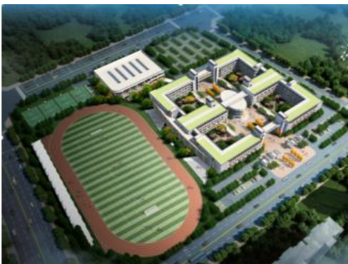
图2 灵均中学鸟瞰图