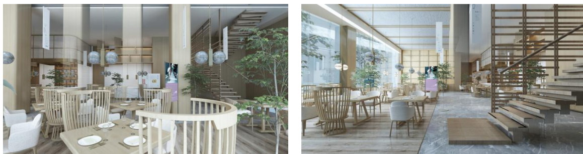
图2 《素·觅》的室内设计

石之硬，木之柔，这两种材质的运用还需要麻制品的柔来进行协调。主要是用麻制品进行软装，像运用在窗帘、家具上，能够很好地烘托自然清新的氛围。对于绿植的选用也是非常重要的，它能够体现人与自然的互动，玻璃能够让人们在室内有非常空旷的感觉。