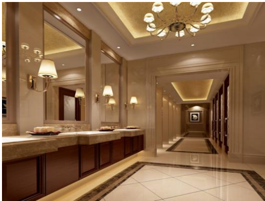
图 14 某酒店大堂卫生间