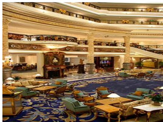
图2 北京励骏酒店公共空间