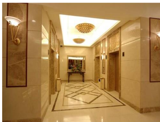
图12 某酒店大堂电梯间