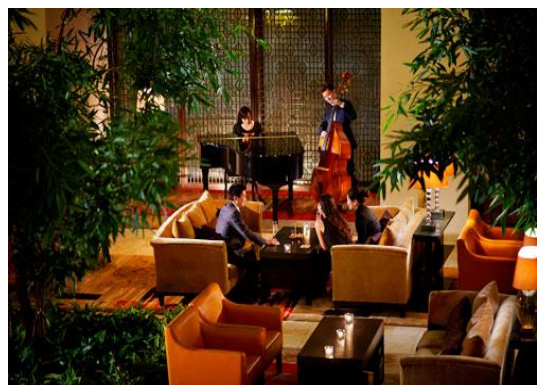
图7 北京 JW 酒店大堂半封闭式休息区

半私密区域,指多层次空间的休息区,视觉层次丰富,类似观赏空间,起到等待、闲聊和观赏的效果。(如图7)北京 JW 酒店大堂半封闭式休息区。