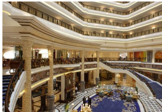
图1 北京励骏酒店公共空间

以城市形象作为焦点的商务酒店中,商务酒店定位不同于其它类型的酒店,其高品位的文化内涵、将进一步推动着当地经济地发展和社会文明,商务酒店大堂的共享空间是一个酒店的文化品味和艺术氛围的体现。其空间构成是整个商务酒共享空间是一个酒店的文化品味和艺术氛围的体现。其空间构成是整个商务酒店空间的关键所在。如(图1、2)北京励骏酒店公共空间。