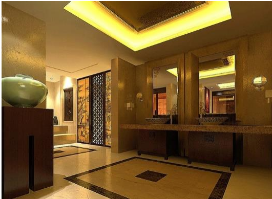
图 13 某酒店大堂卫生间