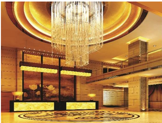
图4 迁西宾馆总服务台

总台办公室、监控室、储藏室等都是酒店整体空间不可忽略的重要因素,将会给整个酒店的经济文化等方面的发展起到一定的推动作用。