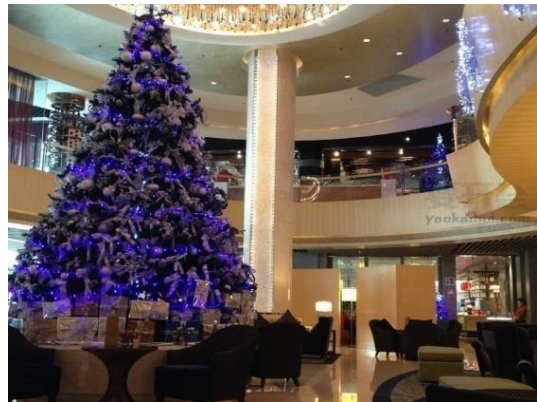
图6 中国大饭店休息区

半私密区域,指多层次空间的休息区,视觉层次丰富,类似观赏空间,起到等待、闲聊和观赏的效果。(如图7)北京 JW 酒店大堂半封闭式休息区。