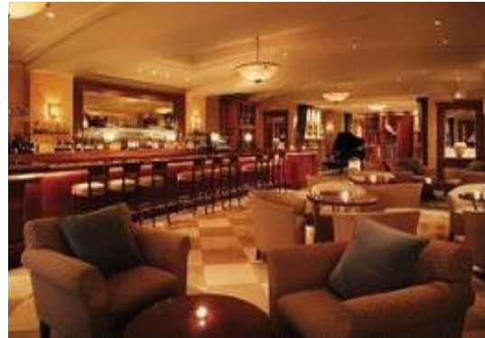
图5 中国大饭店休息区

私密区,指空间低矮的休息区域,其大堂氛围亲切、情感交融,突出私密性,没有偶遇更多的视线,大堂氛围亲切舒适。(如图5、6)中国大饭店休息区。