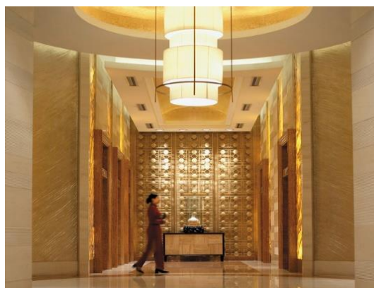
图11 某酒店大堂电梯

商务酒店大堂空间中电梯厅是必不可少的公用空间范畴，是宾客分流量集散地，一般电梯间设置在宾客视觉容易辨认的空间地理位置，以提高宾客的使用效率，以便达到宾客来去自由的空间氛围。常用的电梯厅地面、墙面、顶面其风格上要统一，豪华、设计上应宽敞、明亮、简洁。高档次的商务酒店大堂中，电梯厅可为客人提供休息座椅、茶几等。陈设也是提高电梯间空间中的文化艺术氛围、以提高空间文化品质。电梯间是宾客入住客房的必经之路，其色彩的合理应用，将会给宾客留下色彩视觉的审美空间效果。（如图11、12）某酒店大堂电梯间。