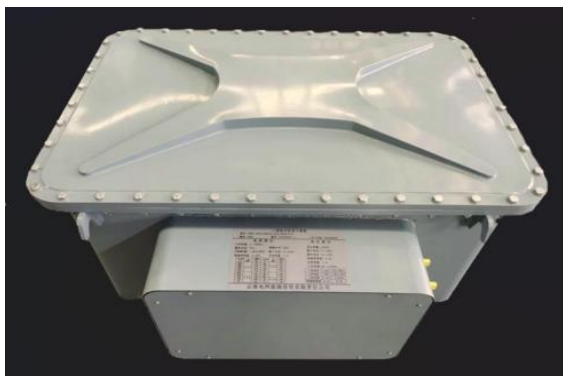
图 1 标准装置俯视图

一体化标准装置在正面位置设计有可开启式盖板,将盖板打开之后,内部的接线盒区域清晰可见,该区域内规范布置有多种专用接线端子与结构部件,具体包含三相升压器电源输入端子一组、三相升压器电源输入端子一组、三相标准电流互感器二次端子一组、三相标准电压互感器二次端子一组以及专用接地柱。在上述各类端子与部件中,三相标准电流互感器二次端子与三相标准电压互感器二次端子有着明确的专用用途,仅用于标准器自身送检检定工作,在日常开展试验检测作业的过程中,这两组端子不需要进行任何接线操作。与此同时,一体化标准装置在整体结构上还进行了人性化与实用化设计,专门设置了吊装位、叉车位以及具备支撑功能的滑轮,能够有效满足设备搬运、移动、安装固定等多场景使用需求,具体结构布局如图 1 所示: