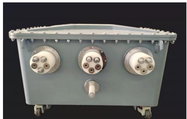
图 3 标准装置出线侧

一体化标准装置的一次出线部分设置有 A、B、C、N 四个专用接线柱,满足三相四线制的检定接线需求。其中 A、B、C 三个核心接线柱结构一致,每一个均由 L、L1、L2、L3、L5 五个接线柱组成,各自对应明确的功能与量程:L 为一次电流极性端,L1 至 L4 分别对应 300~600A、75~200A、30~60A 以及 10~25A 不同电流量程。在实际检定作业中,工作人员可根据被试电流互感器的额定电流大小,灵活选择对应的 Ln 接线柱进行接线,确保检定过程安全、精准、匹配,具体一次出线接线柱结构与量程划分如图 3 所示: