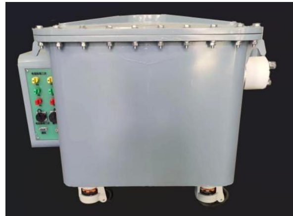
图 2 标准装置进线侧

口与端子,布局合理且便于操作,其上布置有三相标准电流互感器二次端子一组、电源输入航插一组、控制信号一组以及通信接口一组。在装置的内部结构中,还专门配置了功能完善的切换电路,该电路可实现程控自动切换功能,能够将标准器二次侧的多个端子按照检定流程自动完成切换,并最终精准接入误差测量电路。采用此种内部程控自动切换设计,在开展误差校验作业时,工作人员无需再手动更换标准器的二次接线,大幅简化了操作流程,有效减少更换线的工作量,提升检定作业的效率与准确性,具体侧面板结构与布局如图 2 所示: