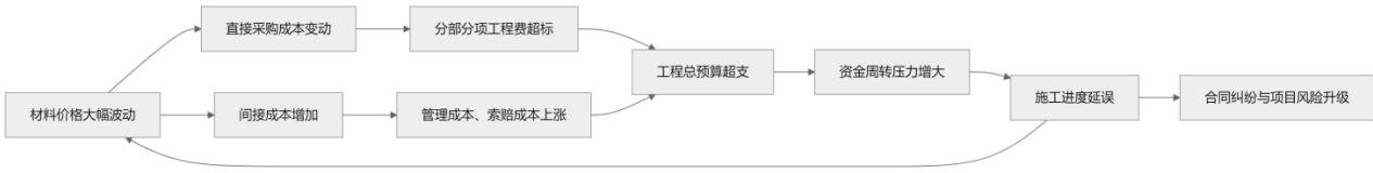
图1 材料价格波动风险传导路径图