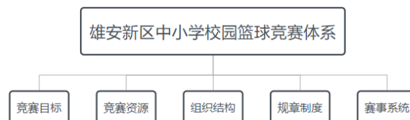
图1 竞赛体系框架图