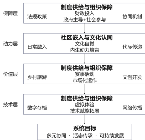
图3 民俗体育活态传承系统模式框架图

作的关键方向。数字采集与存储技术可以对民俗体育的动作技术、音像资料还有口述史料进行系统记录,从而形成完整数字档案,防止文化信息散失和流失。虚拟现实跟增强现实技术为民俗体育的沉浸式体验创造了条件,受众能突破时空限制,感受传统体育的文化魅力。新媒体平台大幅拓展了民俗体育的传播渠道和受众范围,短视频与直播等形式让民俗体育内容能够快速抵达海量用户。在数字传播过程中,要重视内容质量与叙事策略,避免因碎片化传播造成文化误读和价值消解,挖掘民俗体育背后的文化故事与精神内涵,尽力在数字空间中完整呈现并深度传播民俗体育(见图3)。