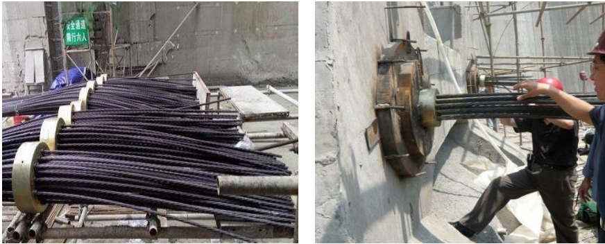
图 1 锚具及夹具

(2) 锚具及夹具应符合国际应力协会编制的《后张预应力体系验收建议》(FIP—91 建议)和《预应力筋用锚具、夹具和连接器》(GB—T1437093)的要求。