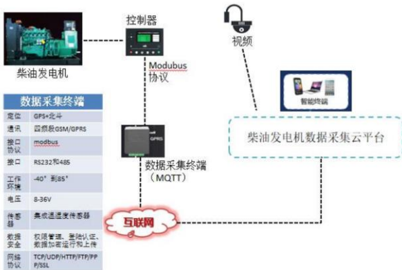
图 1 柴油发电机数据采集平台流程图