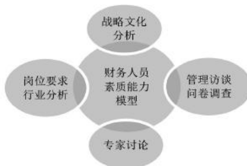
图1 领导力素质模型的构建

财务人员素质模型不但需要重视素质的特点，并且需要对组织的工作计划需求加以关注。从发展规划分析，管理工作安排，人员安排需要等多个方面入手来对财务人员综合能力加以培养，现实工作中经过大量的信息分析研究可以从四个层面来构建财务人员素质模型（见图1）。