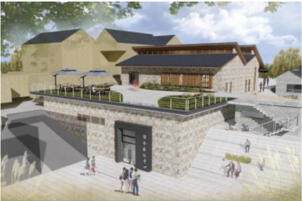
图7 综合会议中心的高差处理

高差处理与景观渗透：针对场地内原有高差，设计团队采用“步移景异”的策略，通过错落式布局和绿化平台消解地形限制，形成室内外互动的景观体验。（图7）