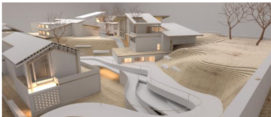
图8 民宿建筑设计方案1—错落有致的空间布局

根据村庄的地形地貌和自然环境，进行合理的整体布局。民宿建筑群的空间布局充分考虑了游客的住宿体验与休闲需求。通过灵活的空间划分与功能布局，实现了居住、休闲、娱乐等多种功能的完美结合。注重了室内外空间的互动与融合，如设置开放式阳台、庭院等，充分尊重原有地形和生态环境，通过合理的规划布局和景观设计，实现建筑与自然环境的和谐共生。在设计中，保留场地内原有高差，形成步移景异的效果（图8）。