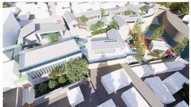
图10 民宿建筑群方案2景观设计

北崮山村民宿的环境营造注重了自然与人文的结合。通过绿化、景观小品等设计手法，营造出了既清新自然又充满人文情怀的住宿环境（图10）。同时，设计团队还注重了与周边环境的协调与融合，使民宿成为北崮山村一道亮丽的风景线。