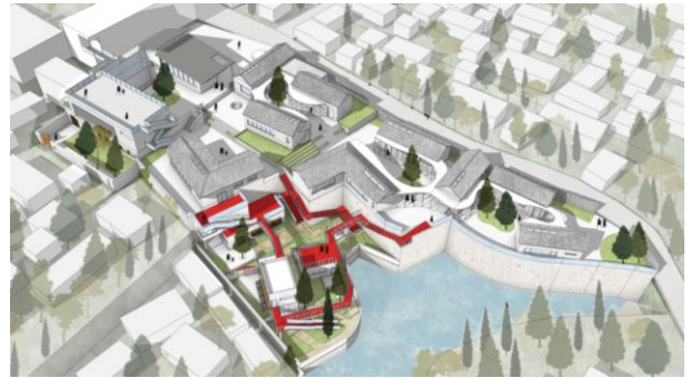
图9 民宿建筑群设计方案2整体效果图

土木结构等元素，同时融入了现代建筑设计的简约、时尚风格。通过运用现代建筑技术和材料，打造出了既具有传统韵味又符合现代审美的民宿建筑群（图9）。