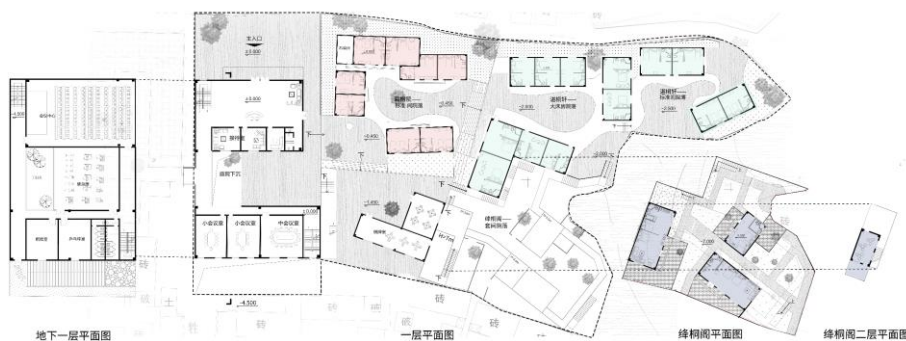
图6 民宿建筑群方案2平面布局图

去边界化设计：基于传统合院布局，通过可移动隔断、中庭等手法重构空间。原有建筑被划分为多个独立民宿套间，但未完全割裂内部公共区域，形成“半开放、可渗透”的空间网络。例如，起居室与休息空间通过可移动隔断灵活分隔，既满足家庭亲子需求，又保留了传统院落的共享性（图6）。