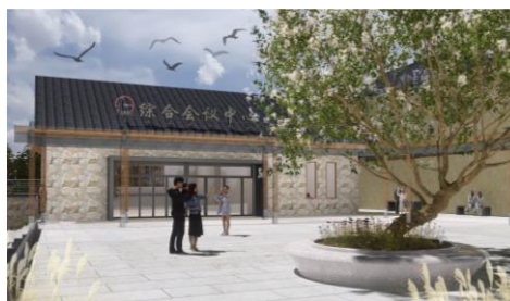
图4 综合会议中心入口