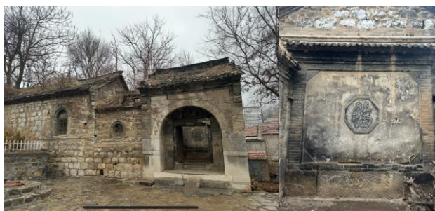
图3 焦家大院的门楼与影壁

(2) 空间基因。整个北固山村顺应山势地形，形成错落式院落布局。其中以焦裕禄故居为代表的北方四合院，通过“前堂后寝、左厨右塾”的布局，将家族伦理与自然节律相统一。而南固山村“四围门”防御体系、北固山村的岳阳门，则构成“内向型聚落-外向型防御”的空间复合体，反映明清时期鲁中山区的社会结构特征。