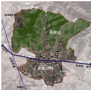
图1 北崮山村区位图

面环山、一水贯村的空间格局, 自明代建村以来, 逐渐形成了以木构框架与混合砌筑为核心的硬山顶民居体系(图2), 其传统建筑基因可以从以下三重维度解构: