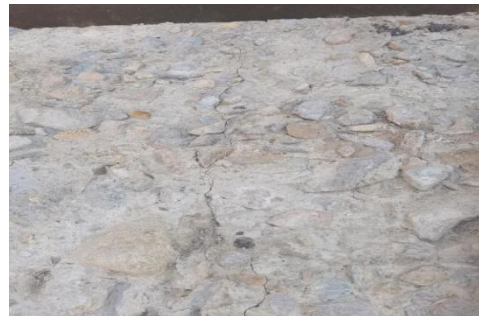
图 2 裂缝位置图 (浇筑仓面处)

砼裂缝位于 8#坝段中间偏右侧, 距 8#-9#坝段横缝 5.70m, 距 7#-8# 坝段横缝 12.4m。裂缝面走向为与坝轴线基本垂直, 竖向下部偏向河床, 倾角 77^\circ 左右。裂缝上、下游方向长度 3.74m, 高度从 334.5m 高程往下延伸直至基岩 330.0m 高程。8#坝段 ( \nabla 330.0m \sim \nabla 334.5m ) 砼坝体上游坝面坡比为顺坡 1: 0.04, 下游坝面坡比为顺坡 1: 0.196。裂缝情况详见图 1-2。