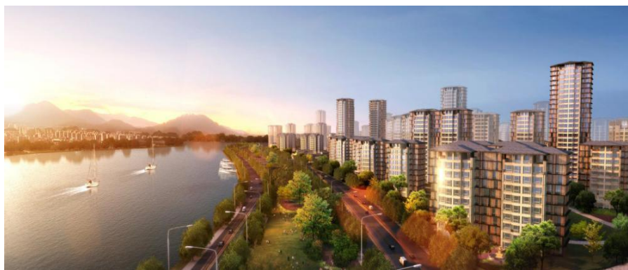
图 1 项目效果图

为满足城市界面的丰富性，采用四种立面形态，单体类型丰富（如图 1），实施装配式建筑涉及 104 栋多、高层住宅。