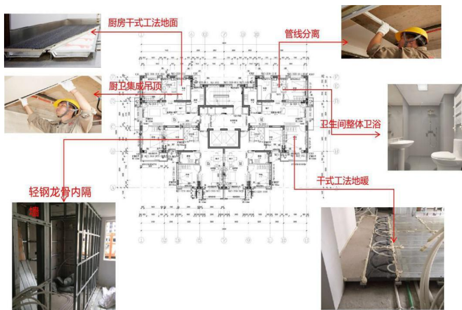
图5 管线分离、干法施工示意

项目涵盖结构构件装配式及装配式装修。主体结构是采用装配整体式剪力墙结构体系，其中楼梯、内外墙板、叠合板以及阳台板、空调板均为预制构件（如图4）。内隔墙、地板、厨卫空间采用管线分离技术（如图5），采用干法施工，致力于提升施工速度与精度，减少湿作业和建筑垃圾。