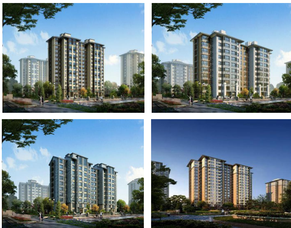
图 3 建筑立面效果

职工周转房项目采用了四种立面形态，丰富城市空间。对标准户型、楼层平面、标准楼座进行设计和排布，结合屋顶、颜色、空调百叶、栏杆、门窗等元素进行多样组合，调整材料质感，以形成了丰富的立面效果（如图 3）。